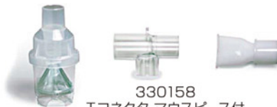
330158 Tコネクタ マウスピース付